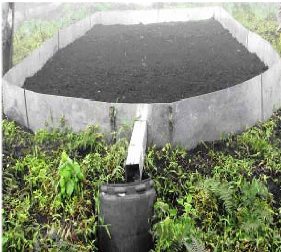
Figura 2. Características de la unidad experimental en la microcuenca del río Alumbre.

En esta investigación se utilizó un Diseño de Bloques Completos al Azar (DBCA), con cuatro tratamientos que consistieron en suelo labrado, cultivos de maíz (variedad local Guate), fréjol en monocultivo (variedad INIAP-412 Toa) y pasto que el agricultor mantenía (kikuyo, establecido desde hace ocho años), con tres repeticiones.